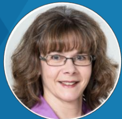
Technik Ilona Gehrig PROvendis