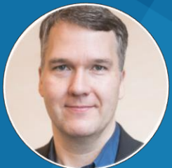
Software Sven Friedl Charité/BIH Innovations