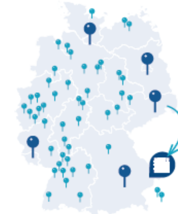
TransferAllianz e.V. Mitglieder Stand April 2023

TransferAllianz e.V. | Unsere Mitglieder