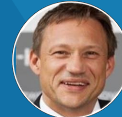
Patentvalidierung Peter Stumpf TransMIT